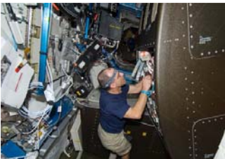
WRSラックを設定するドナルド・ペティ宇宙飛行士(飛行6日目)