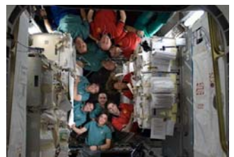
レオナルド内で記念撮影を行うISSクルーとSTS-126クルー(飛行8日目)

11月20日、ISSは、最初の構成要素である「ザーリヤ」(基本機能モジュール)の打上げから、10周年を迎えました。また、11月21日には、プログレス補給船(31P)のドッキングに備え、スペースシャトル・エンデバー号のスラスタを使用した軌道上昇(リブースト)が行われました。31Pは11月26日午後9時38分にロシアのソユーズロケットにより、カザフスタン共和国のバイコヌール宇宙基地から打ち上げられ、11月30日午後9時23分にISSへドッキングする予定です。