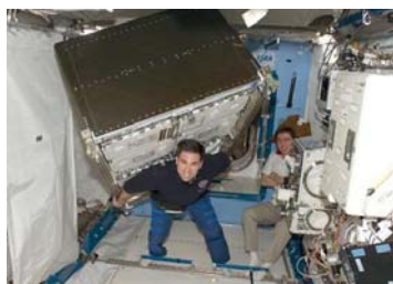
船内実験室へ米国の実験ラックを移設作業中のシャミトフ(中央)、ヴォルコフ(右)両宇宙飛行士