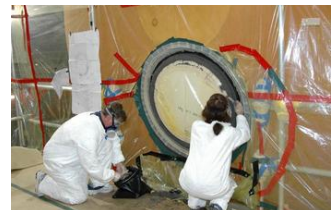
ET底部のふたを閉じる作業の様子