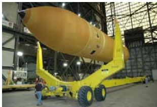
VAB内に水平に設置されたET

なお、NASAはETの断熱材の一部を除去した形状で飛行しても問題ないかどうか確認するための風洞試験を実施中です。この試験結果によっては作業予定が変更される可能性がありますので、引き続きお知らせしていきます。