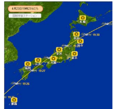
＜4月23日19時23分頃のISSの飛行経路＞