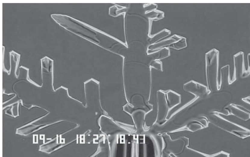
図1 不凍糖タンパク質を入れた水溶液からできた氷

このように、不凍(糖)タンパク質が氷の結晶成長をコントロールするしくみが解明できれば、冷凍技術の向上や臓器移植への活用など、生活のさまざまなシーンに役立つことが期待されます。