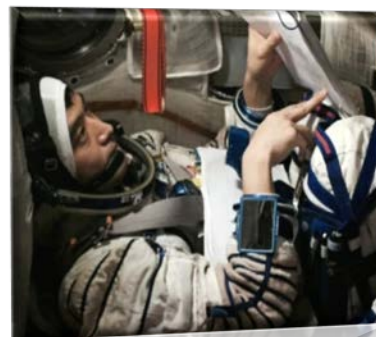
ソユーズシミュレーション訓練