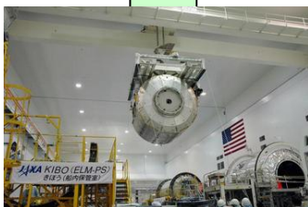
クレーンにより運ばれる「きぼう」船内保管室