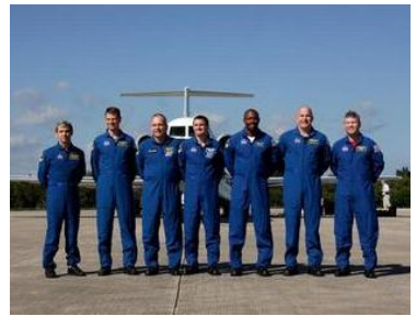
打上げのためKSCに到着したSTS-122クルー

http://www.nasa.gov/mission_pages/shuttle/shuttlemissions/sts122/ (NASA: 英語)