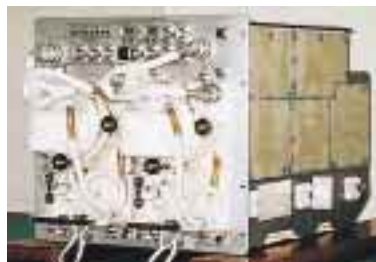
海水型水棲動物実験装置 (VFEU / NDAS) Vestibular Function Experiment Unit / Neural Data Acquisition System (VFEU/NDAS) ガンアンコウを長期間飼育し、神経活動などのデータを記録する装置。 Neural Data from Oyster Toadfish kept for a long period in the unit are recorded.