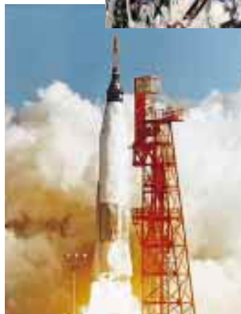
マーキュリー宇宙船の打上げ / Launch of Mercury spacecraft