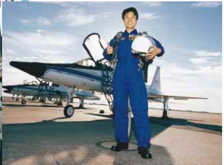
T-38ジェット訓練機で訓練中の向井宇宙飛行士 / Astronaut Mukai during T-38 Jet Training