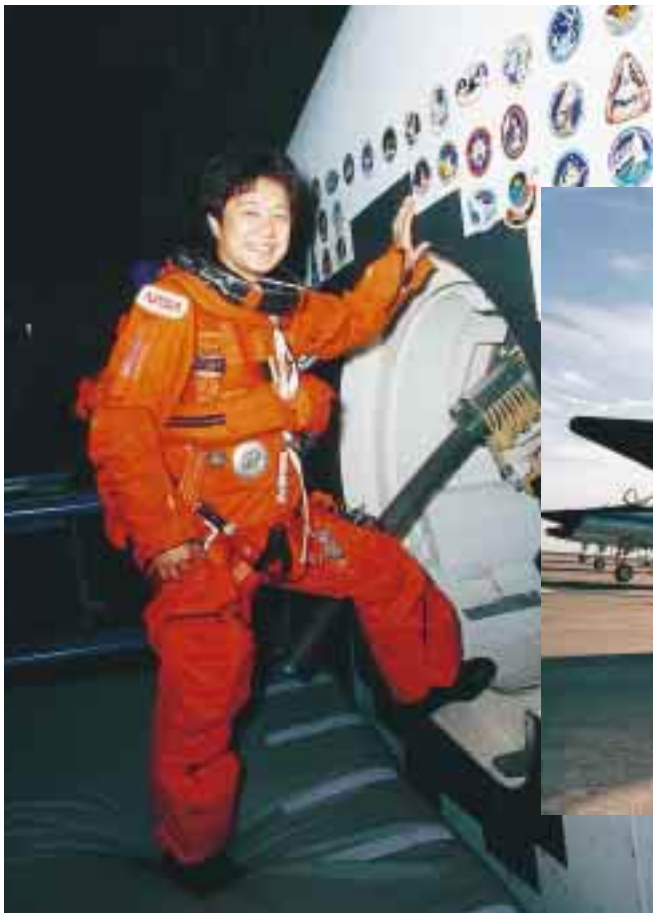
シャトル訓練設備で訓練中の向井宇宙飛行士 / Astronaut Mukai entering Shuttle Training Facility

Astronaut Mukai is assigned to conduct a plant growth experiment, an organic crystal growth experiment, a space motion sickness experiment using an Oyster Toadfish, a sleep experiment to acquire data on brain waves during sleep.