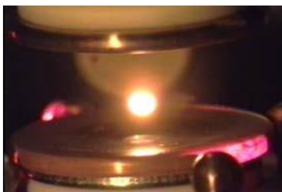
図1 地上静電浮遊炉での浮遊と加熱