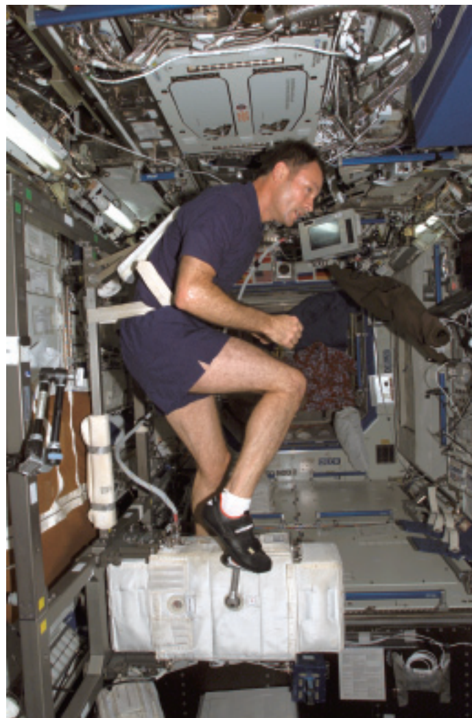
国際宇宙ステーションでトレーニング中の宇宙飛行士 長期滞在では骨量が減少するため長期滞在の宇宙飛行士は運動が日課になっているが、それでも防ぎきれない。

宇宙飛行士が、この薬を投与することについて説明を受け、同意をすれば、実験がスタートすることになっています。