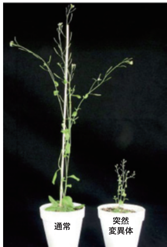
図2 通常に育ったシロイヌナズナと突然変異体の写真

細胞壁を支えるように細胞膜と微小管がある。微小管に重力が加わったことを感知すると、核から様々な遺伝子が働くように指示が出て、結果的に細胞壁が強くなるように働く。