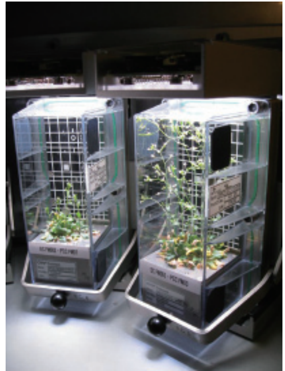
図3 地上予備実験として宇宙実験用の培養装置(Plant Cultivation Chamber)を用いて生育中のシロイヌナズナ(ノルウェーのESA実験室)

この実験では、シロイヌナズナの成長の様子を、宇宙での微小無重力下、回転による重力下、地上での対照実験の3種類で比較します。また、地上に持って帰った茎全体を引っ張ってその強度を物理的に計測します。さらに遺伝子を解析し、どの部分でどんな遺伝子が働いたかを調べます。