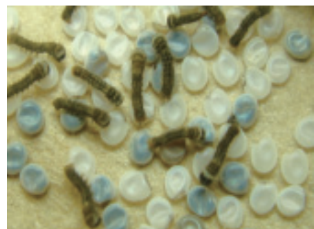
図2 カイコの卵と孵化している様子 白いのは卵殻で幼虫が抜け出した後のもの。卵がくぼんで中が黒っぽいのが、孵化直前の幼虫がまだ入っている。卵殻を内側から食い破って幼虫は出てくる。白い抜け殻の口の開いたところが食い破ったところ。

(参考資料: 科学のアルバム「カイコ まゆからまゆへ」 岸田 功 著 あかね書房)