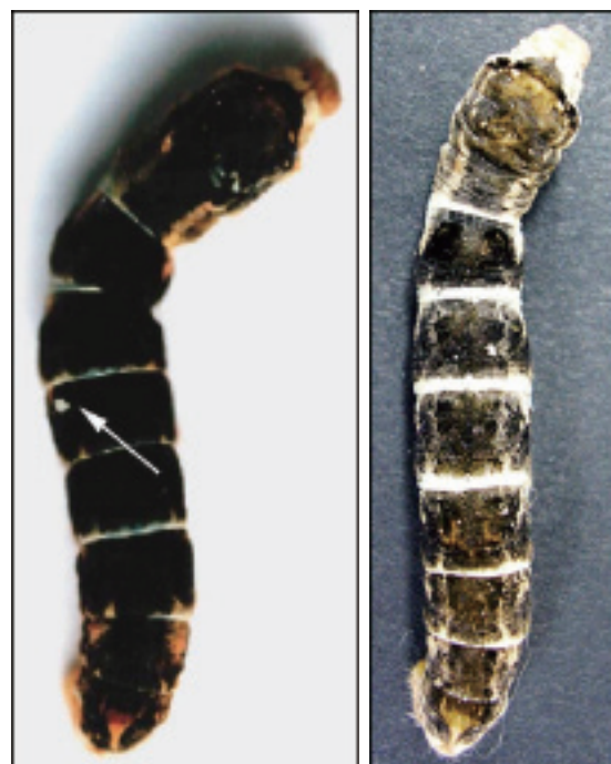
図3 放射線を当てたカイコ

地上でカイコ(黒い皮膚をした系統)に放射線を当てると、幼虫の5齢の時期に白い斑点をもったカイコが現れる。エネルギーの高い放射線を当てると、斑点の数が増えた(右の写真)。