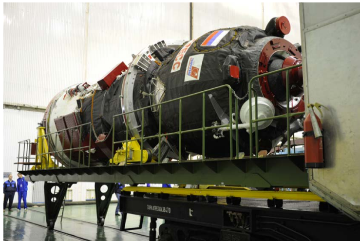
打上げ準備中のプログレスMS-07 (RSCエネルギー)

プログレスMS-07補給船は、当初、日本時間10月12日午後6時32分にカザフスタン共和国バイコヌール宇宙基地から打ち上げられる予定だったが、同10月14日午後5時46分に変更された。また、打上げから2周回後(約3時間後)にISSへドッキングする運用が予定されていたが、打上げ変更に伴い、打上げから約2日後にISSへドッキングする運用に変更された。