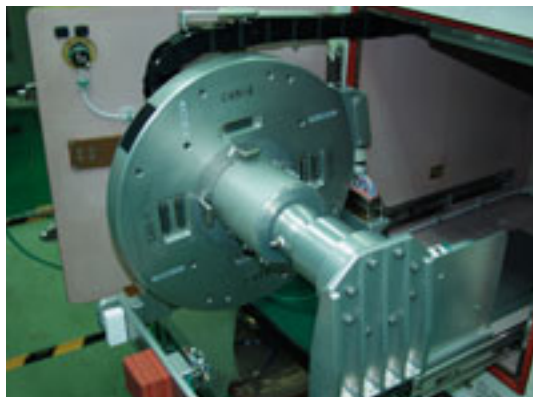
セントリフュージ(人工重力発生機)

インキュベータには、培養室として、以下の2つの培養部が用意されているため、微小重力環境と重力がある環境での対照環境を同時に提供できます。