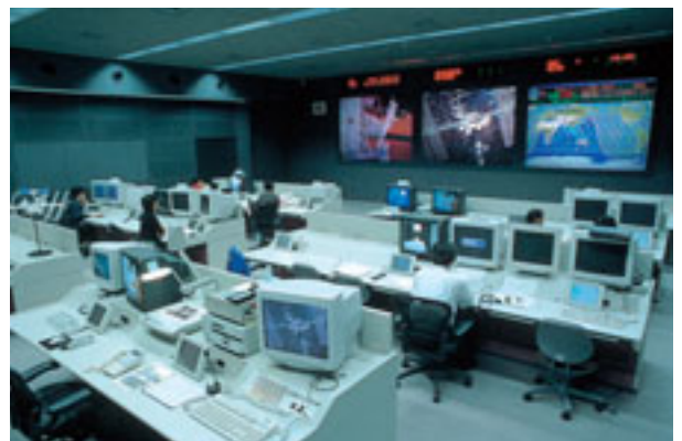
筑波宇宙センターの運用管制センター